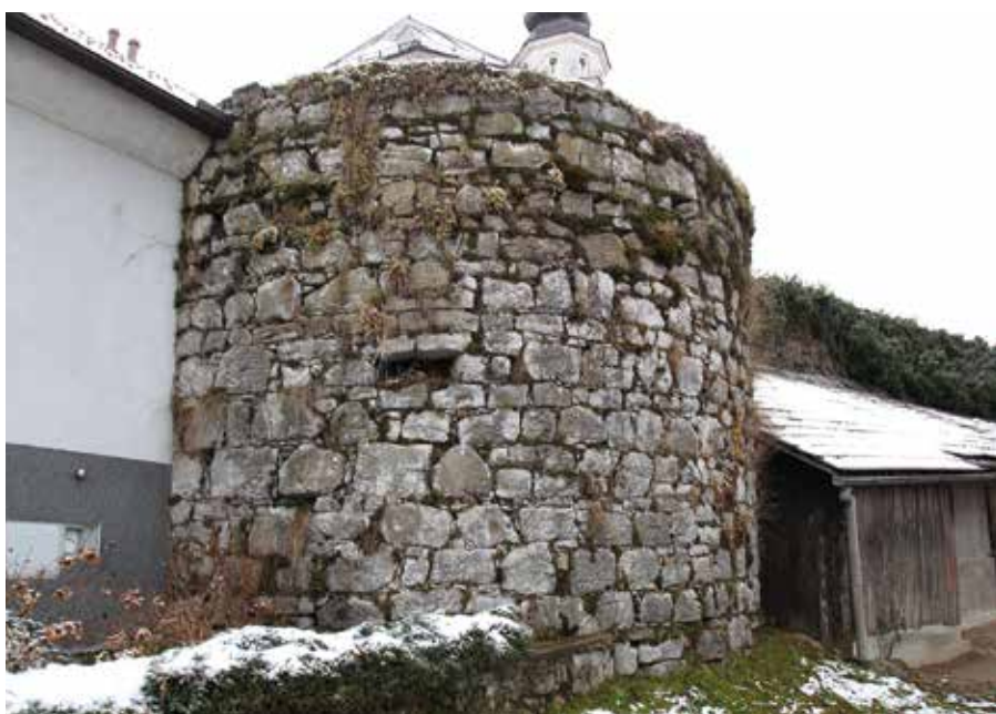
Pravokotna strelna lina v polkrožnem stolpu

Lazar, Tomaž: Oborožitev slovenskih dežel v začetku 16. stoletja: münchenski rokopis Cod.icon 222.V: Zgodovinski časopis, 2017, št. 1/2, str. 106–162.