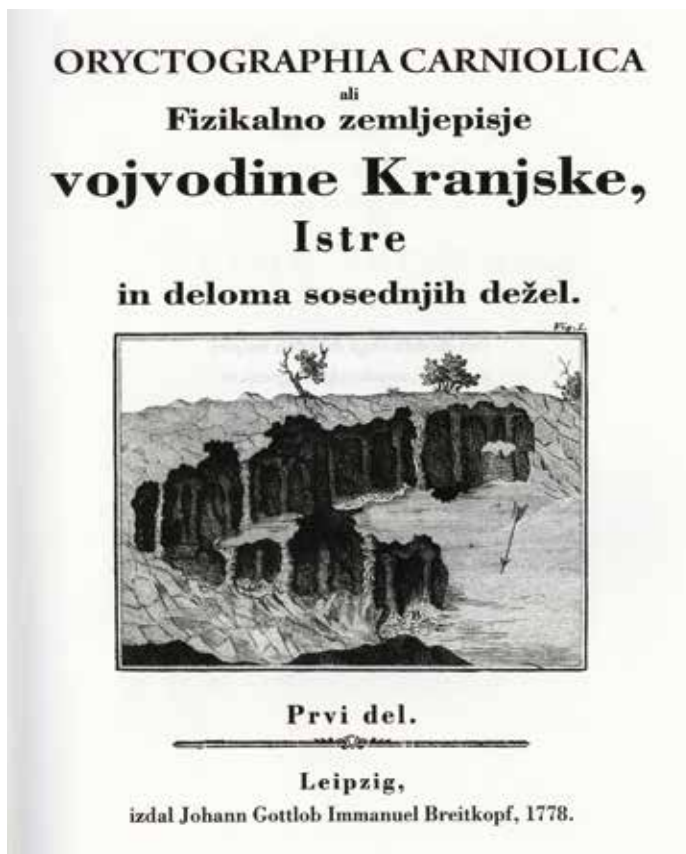
Naslovna stran prvega dela Oriktografije

Iz Logatca se je Hacquet odpravil »proti jutrovi strani, da bi prišel v zadnji del glavne verige, do slavnega gorskega jezera, ki leži nedaleč od kraja Cerknica (Zirknitz) in ima po njem ime ... Kot navaja naprej, je »v suhem delu leta 1773« prišel tudi do Zadnjega kraja in šel naprej do vasi Otok in Laze, omenja izvire, potem do Gorenjega Jezera in do vasice Goričice (Gorice). Da je prišel do vasi Dolenje Jezero in Dolenja vas, je moral prečkati Lipsenjščico, Žerunski obrh in Globovšček. Hacquet se je odločil, da obide celotno jezero, »kar mi je tokrat uspelo z veliko napora dokončati v osmih urah, ker je zelo naraslo ... sem ubral pot na večerno stran proti Karlovi, kjer sem nedaleč stran naletel na steklaro, ki je v precej dobrem stanju in v kateri delajo Čehi.« Pot je nadaljeval proti Loškem: »Ko sem bil še uro hoda od gradu Loka, sem v predgorju naletel na nekaj sivega roženca, ki je bil po barvi