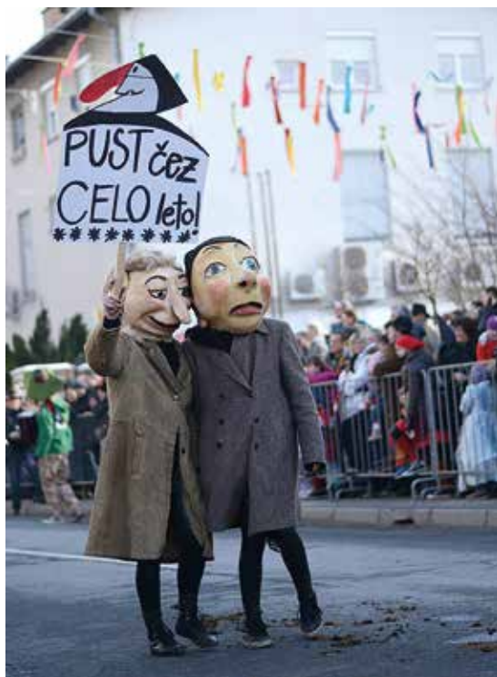
Pazite, kaj si želite, lahko se uresniči.

» Pustni teden se začne v četrtek, 11. februarja, in konča v sredo, 17. februarja.«