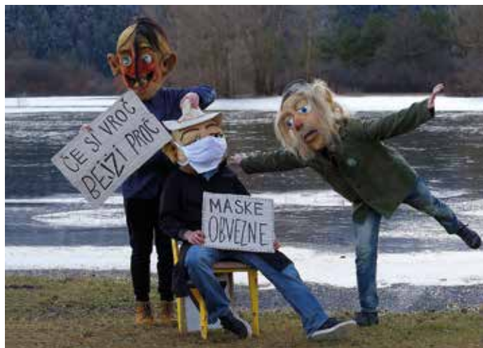
Butalci so odgovorni in opozarjajo na nujnost upoštevanja ukrepov.

Seveda pri pustovanju ne gre le za Pustno društvo in pustno vzdušje,