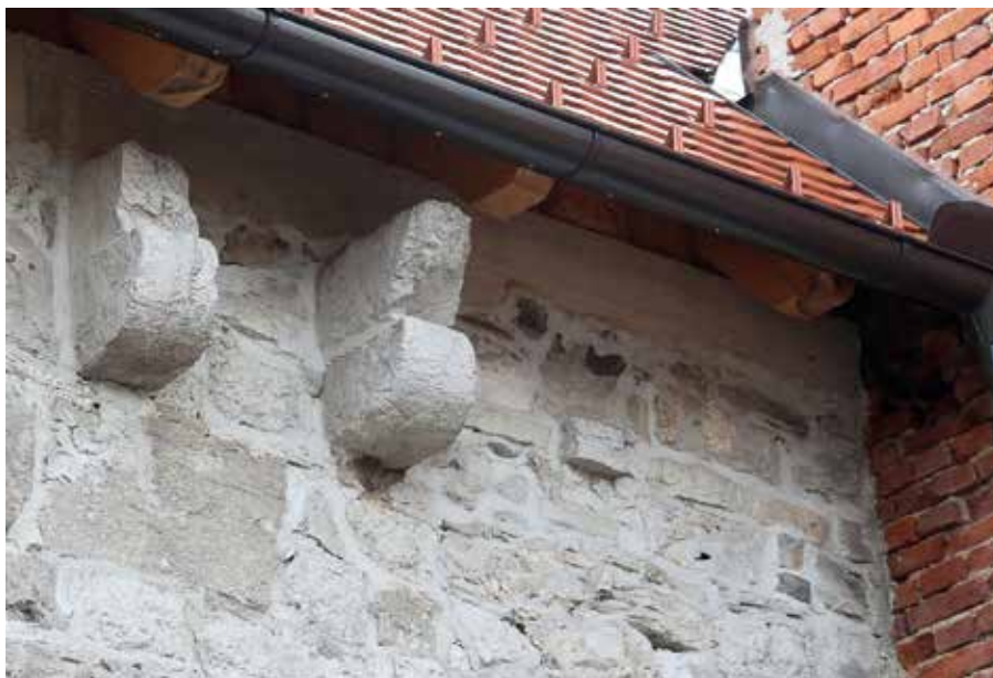
Izlivnice na protiturškem obrambnem zidu

Edini ohranjeni polkrožen stolp v cerkniškem protiturškem taboru je za sedanjo Turšičevo hišo. O ohranjeni strelni lini pa je Tine Schein povedal: »V prvem nadstropju je ohranjena pravokotna lina, dolga približno 70 centimetrov in visoka nekaj več kot 20 centimetrov, notranjosti te line danes ne moremo rekonstruirati, je pa narejena tako za puško kot tudi za samostrel. Lina se proti notranjosti oži, potem se razširi, kar omogoča širši kot streljanja, pa tudi lažjo manipulacijo s samostrelom oziroma z ognjenim orožjem za obrambo samega protiturškega tabora. Ta polkrožni stolp je imel lesene pode v vsakem nadstropju, ki so bili visoki do dveh metrov in pol, kar je omogočalo komunikacijo med branilci stolpa in celotnega obzidja. Zakaj je ta stolp v vogalu? Predvsem zaradi obrambe obzidja med Jurčkovim taborom in stolpom nasproti Urhove hiše. Prav gotovo pa lahko pričakujemo na tem stolpu še dve strelni lini, ena obrnjena proti Urhu, druga pa proti Jurčkovemu taboru, ki sta branili direktni dostop do obzidja.«