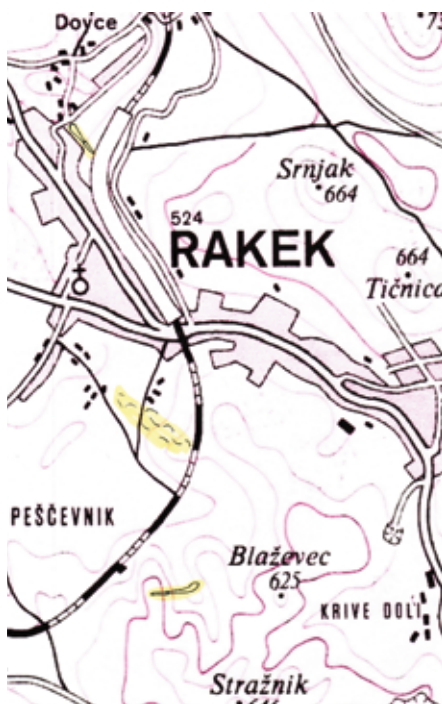
Prikaz smučišča in skakalnic na zemljevidu

Tik ob železnici se je odvijalo alpsko smučanje. Na zemljevidu Rakeka z okolico je smučišče vrisano in označeno z rumeno barvo, kar velja tudi za skakalnici.