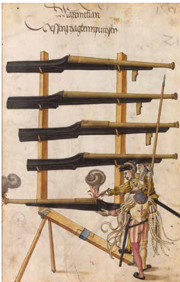
Prikaz streljanja s težko kavljasto puško (Cod.icon 222, fol. 25r, 72r)