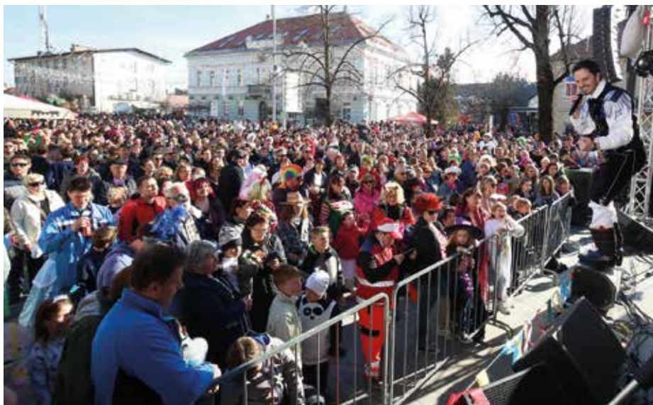
Prizorov, kot so bili lanski, letos v Cerknici ne bo.

smo letos bolj obremenili programsko, ki vam pripravlja vsebine za pustovanje od doma. Na koncu se vse »zgliha«. Prav tako ves čas potekajo tudi dogovori in načrtovanja glede pustne hale, ki jo nameravamo v sodelovanju z Občino Cerknica preurediti v pustni muzej, tako da tudi tehnična ekipa ne počiva povsem. Načrt za prihodnost je, da pustnih figur ne bi uporabljali le na karnevalu, temveč bi si jih lahko obiskovalci ogledali tudi med letom. Res je, da vzdušje pri ogledu statičnih figur v pustni hiši ne bo moglo biti enako, kot je, ko jih vidimo v akciji na karnevalu, vseeno pa lahko ponudimo vsaj malce vpogleda v to, kaj pust pomeni za Cerknico.«