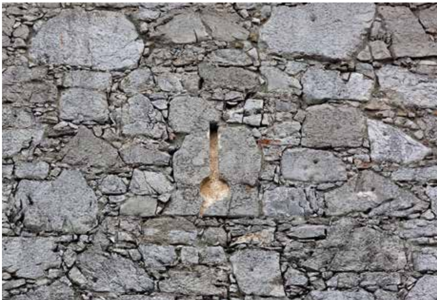
Ključasta strelnica v Jurčkovem taboru

V 15. stoletju je ročno ognjeno orožje postalo ključni del oborožitve pomembnejših gradov. Za obdobje okrog leta 1500 podatke prinašajo ilustrirani popisi orožja v habsburških dednih deželah, ki jih je po naročilu kralja Maksimilijana I. sestavil Bartolomej Freisleben; v popisih, ki so v osnovi zajeli zgolj deželnoknežje posesti, je navedeno tudi orožje na takratnih notranjskih gradovih. Cerknici najbližji Šteberk je imel 12 kavljastih pušk (težja puška z dolgo cevjo in opornim kavljem za streljanje z naslona, prvotno brez netilnega mehanizma), 500 krogel, 50 funtov smodnika (1 funt je približno 560 gramov), 1 sodček solitra in 1 sodček zmlatega žvepla. Sama Cerknica v dokumentu Cod.icon 222 ni navedena.