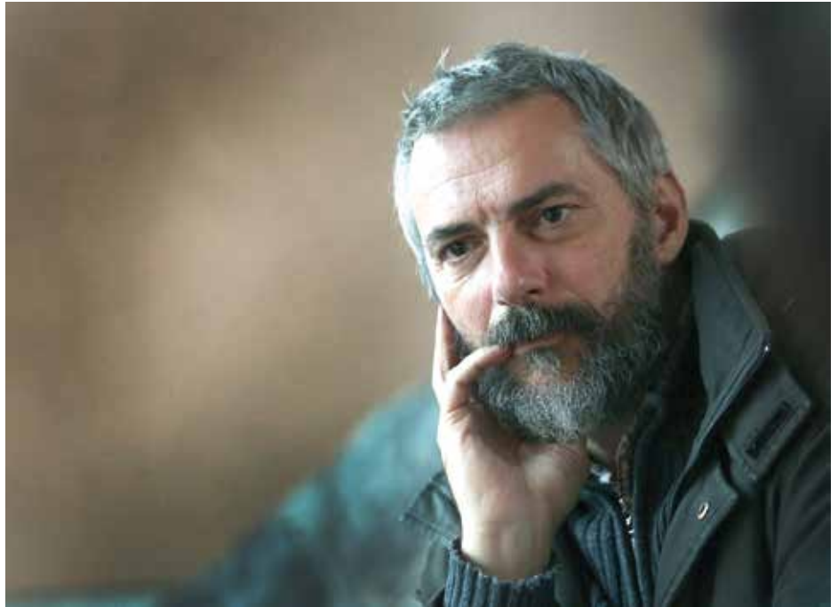
Janežičevi se spomladi vrnejo na Krušče – v mir in k dobrim sosedom.

V psihodrami sem v vlogi psihodramskega psihoterapevta, če nisem udeleženec –